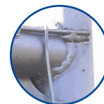
Volledig gelast frame